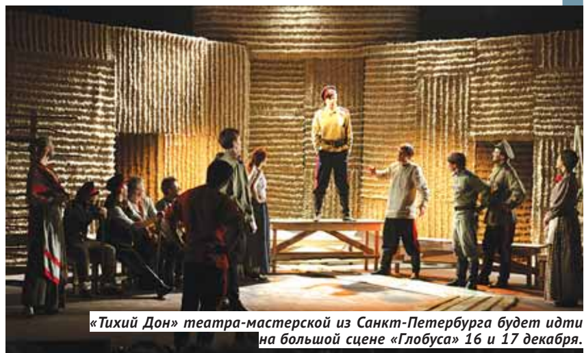
«Тихий Дон» театра-мастерской из Санкт-Петербурга будет идти на большой сцене «Глобуса» 16 и 17 декабря.

В этом году новосибирцев и гостей города ждёт «театральный взрыв»: на разных площадках выступят самые яркие и концептуальные театральные коллективы России — из Москвы,