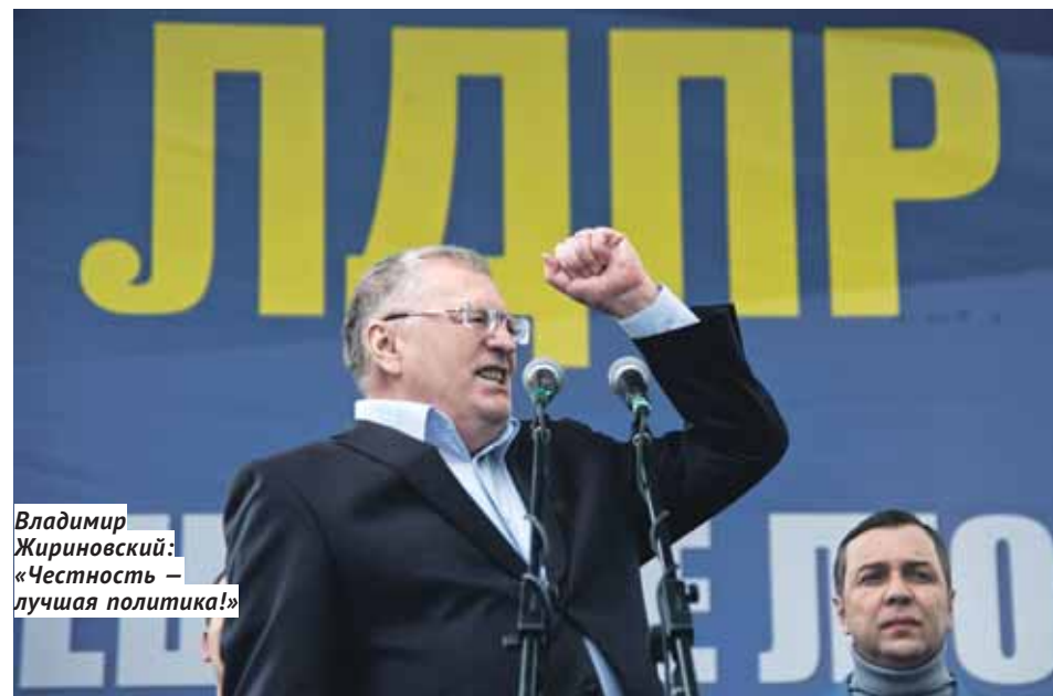
Владимир Жириновский: «Честность — лучшая политика!»

ограничения для иностранных компаний, имея в виду наши, российские. Получается, что Россия стала единственной в мире страной, которая выступает за неограниченную свободу прессы. У нас всё ещё обсуждают, считать ли иностранные СМИ «иностранными агентами». А в Америке — не обсуждают. Вообще, с тех времен, когда Америка считалась «свободной страной», там многое поменялось. Например, модель государственного управления. Мы убедились, что в Америке уже не президентская республика, а искажённый, извращённый тип парламентской республики, когда всё решает Конгресс. Именно извращённый. Потому что в нормальной парламентской республике парламент — оплот демократии. А в США, так вышло, Конгресс стоит на стороне истеблишмента, а вот президент как раз избран народом».