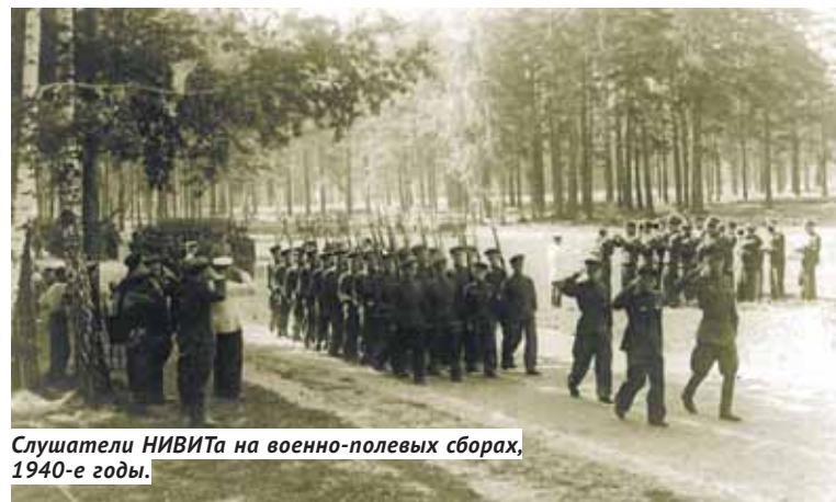
Слушатели НИВИТа на военно-полевых сборах, 1940-е годы.

захватывая территорию СССР, сужали её до своих стандартов. Для оперативности они широко использовали труд военнопленных, местного населения. Соответственно, после изгнания оккупантов требовалось снова расширять колею, и как можно быстрее, чтобы обеспечить материально-техническую поддержку наступающим частям. На своём полигоне слушатели НИВИТа опытным путём устанавливали, сколько нужно минимально за-