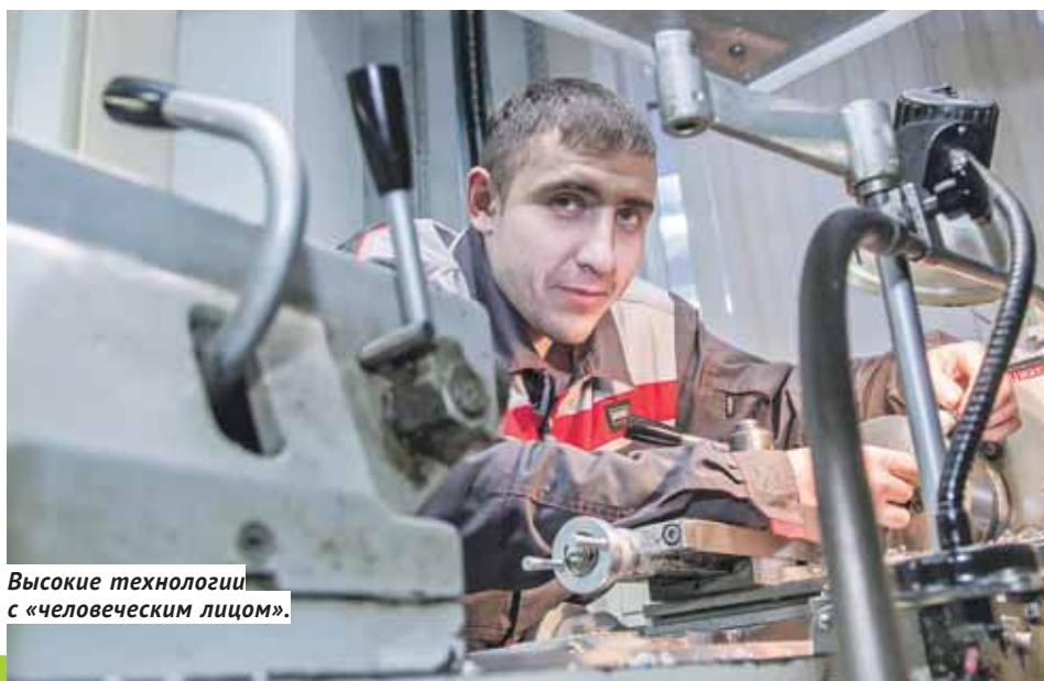
Высокие технологии с «человеческим лицом».

В Центре наноструктурированных материалов компания OCSiAl занима-