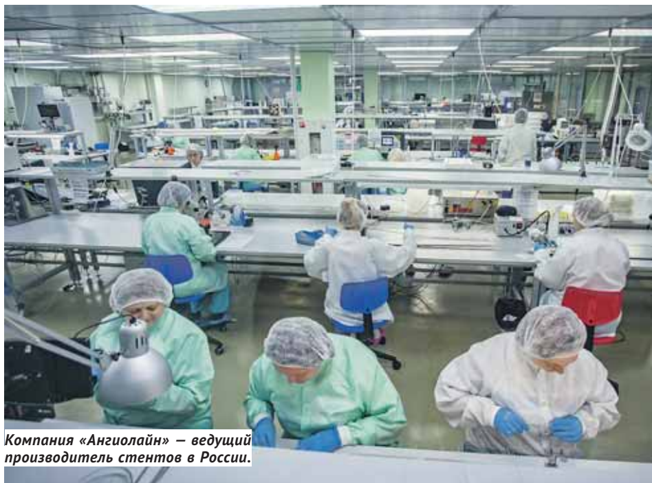
Компания «Ангиолайн» — ведущий производитель стентов в России.

По итогам 2016 года наш Технопарк увеличил выручку до 307 миллионов рублей — чистая прибыль составила 102 миллиона рублей. До этого предприятие было планово убыточным, показывая в разные периоды убыток в районе 30–40 млн рублей. По данным руководства Технопарка, за 10 лет работы его резиденты перечислили более 4,2 млрд рублей налогов, в том числе 2,5 млрд рублей — в бюджет Новосибирской области. Гендиректор Академпарка Владимир Никитин напомнил, что всего в проект было вложено чуть менее 3 млрд рублей государственных инве-