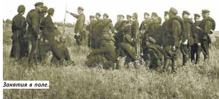
Занятия в поле.

Сотрудники института принимали самое активное участие в решении неотложных производственных и народнохозяйственных проблем Новосибирска, управления Томской железной дороги. Например, в городе остро стоял вопрос очистки питьевой воды